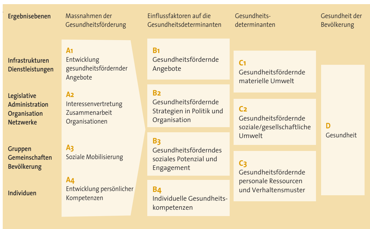
Abb. 2: Das Ergebnismodell im Überblick.